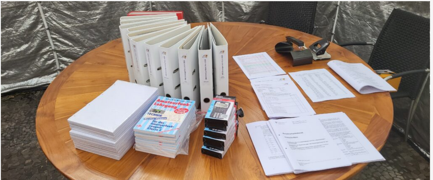
Kurssausschreibung HB3/HB9 Kurs 2025