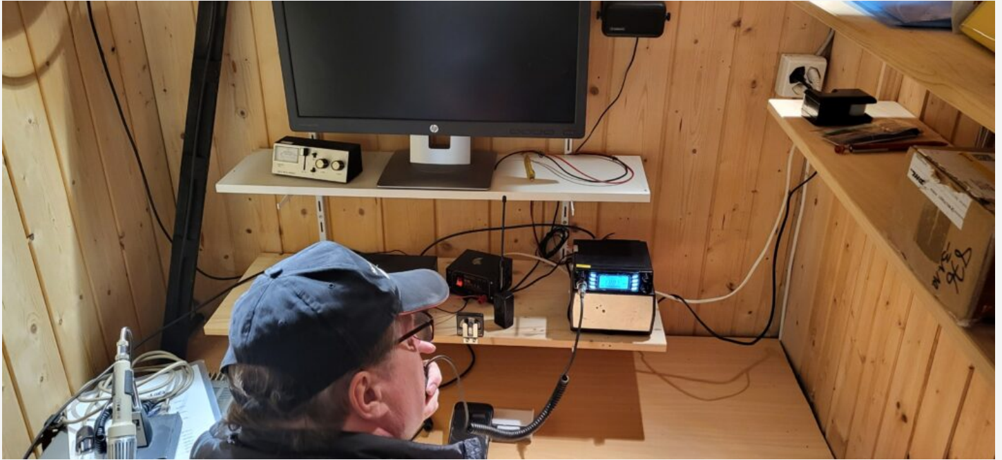
20:45 Uhr Essen hat geschmeckt - ab jetzt sind wir QRV mit Punktefunken bis 23:45