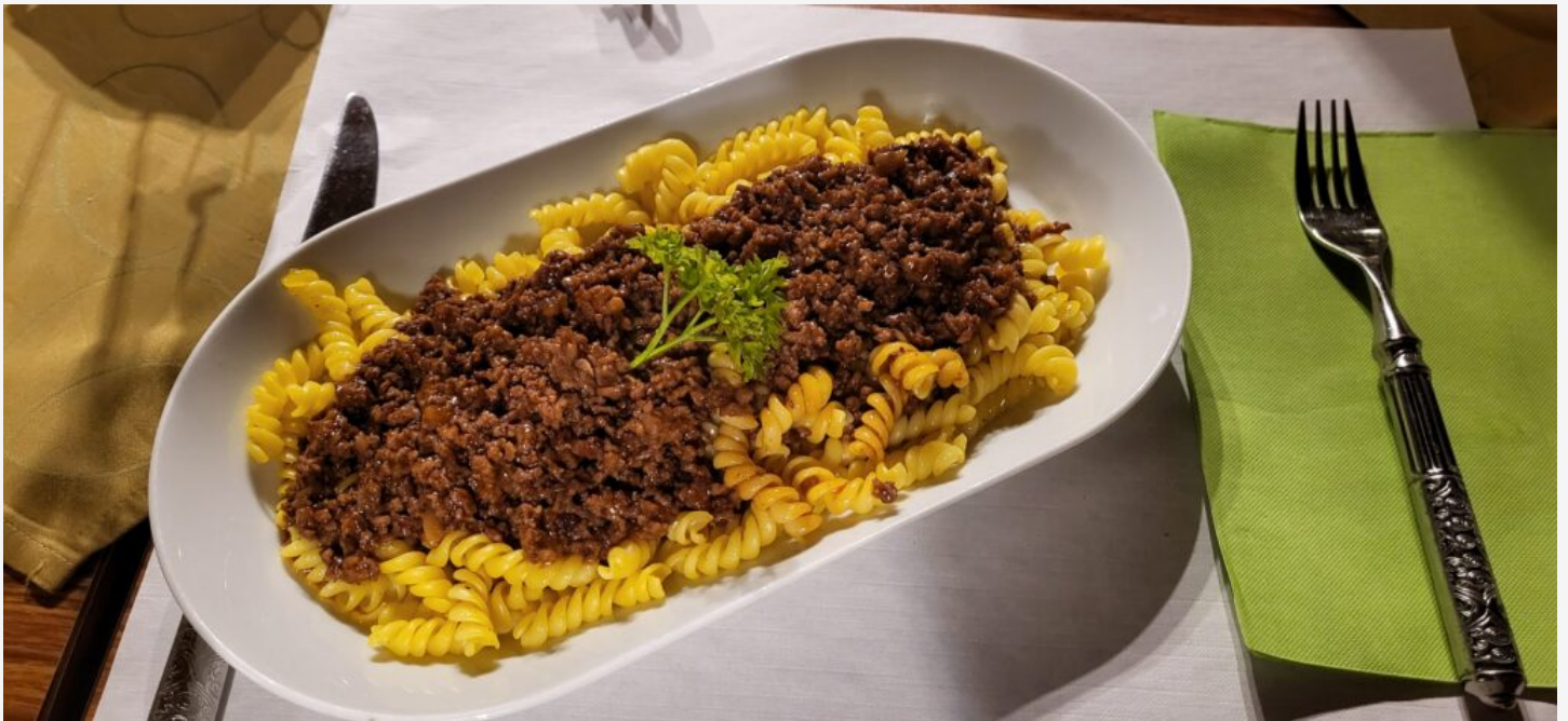
19:41 Uhr jetzt aber zuerst einmal Abendessen. Ghackets mit Hörnli wartet auf uns...