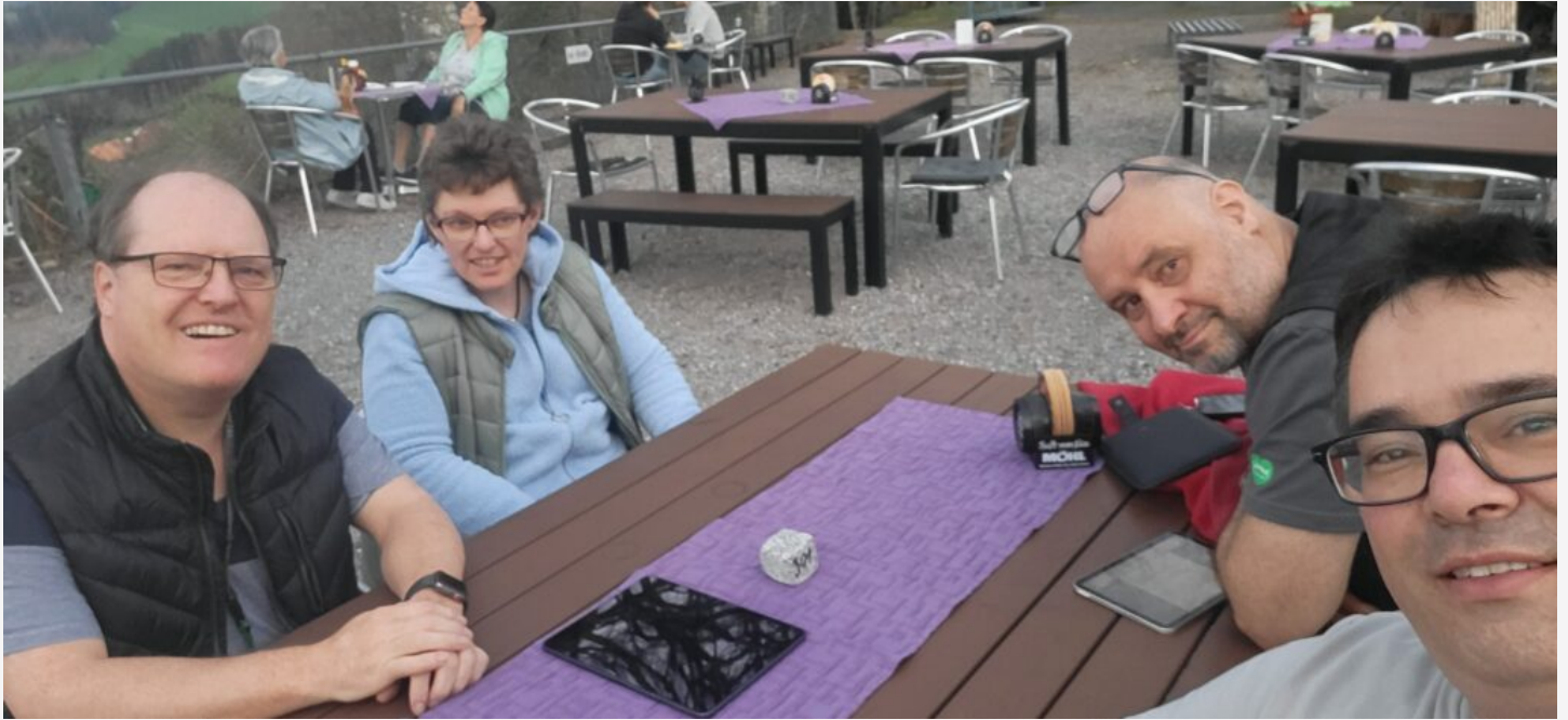
19:40 Uhr Reserve-Antenne (T2LT an Angelrute) ist aufgezogen, als Backup und für Dualbetrieb Hinten die Fix Montierte Gainmaster als Primäre CB-Funk Antenne