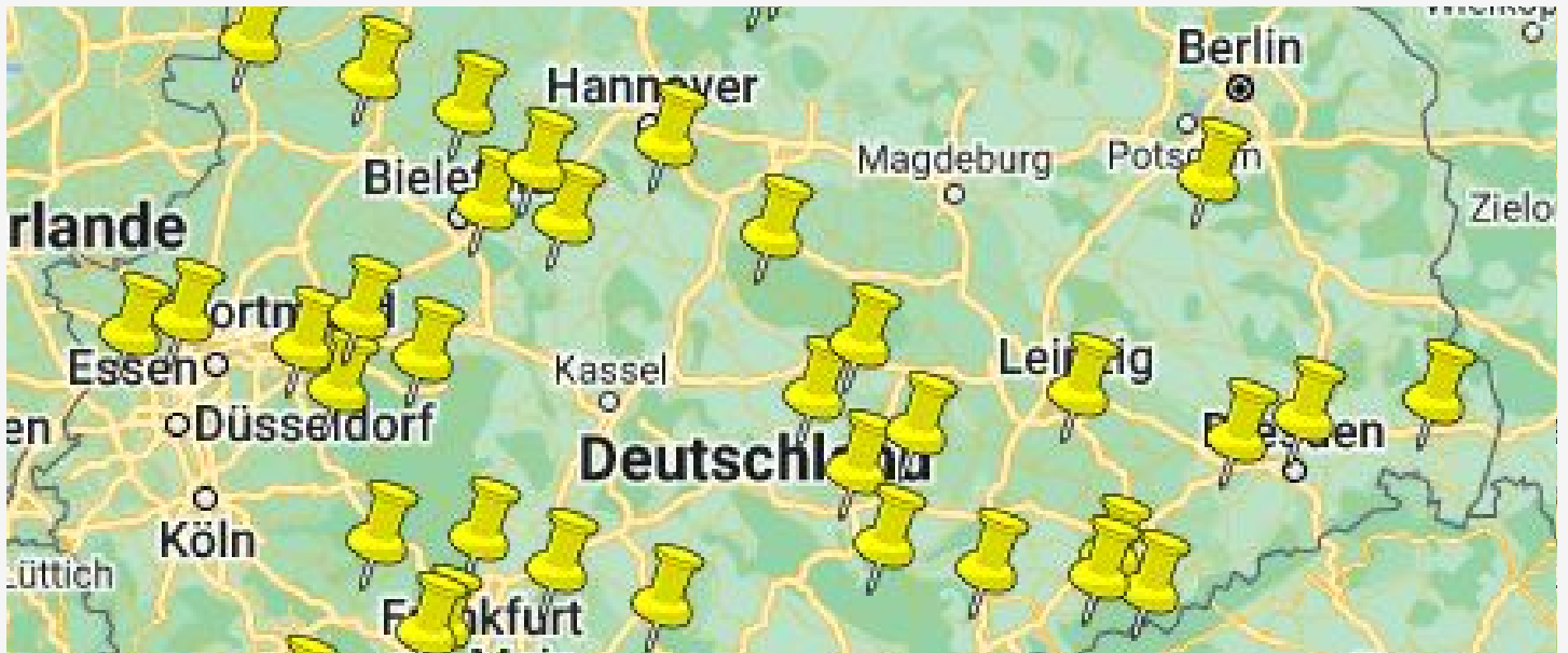
Funkstaffel 2024 - Live-Berichterstattung