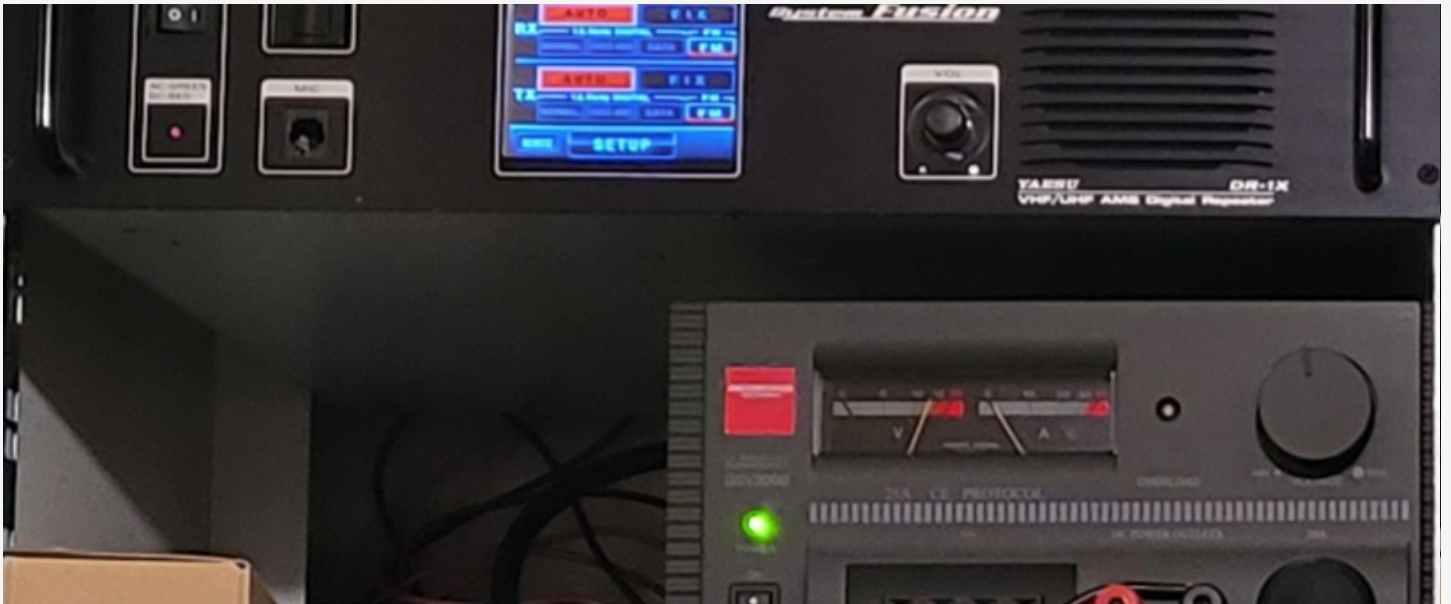
Umbau im Shack - Teil 1